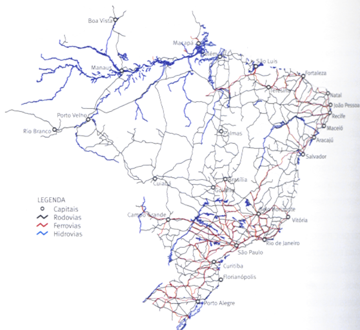
FIGURA 1 | PRINCIPAIS CORREDORES DE TRANSPORTE NO BRASIL