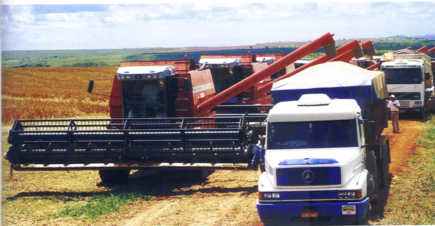
Colheita e transporte de grãos de soja: MT, 2005

Um dos fenômenos mais marcantes observados na economia agrícola brasileira nas últimas décadas (e de forma acelerada nos anos mais recentes), é a verdadeira revolução que vem ocorrendo em seu arranjo espacial. Os negócios agropecuários foram ocupando áreas de fronteiras, como o Norte e o Centro-oeste, além de vastas áreas do Nordeste, em geral por meio de atividades que incorporam modernas tecnologias de produção. Paralelamente, fornecedores de insumos, armazenadores e indústrias de processamento se aglomeraram ao redor das zonas de produção, visando principalmente à minimização dos custos de transporte, atendendo, assim, aos